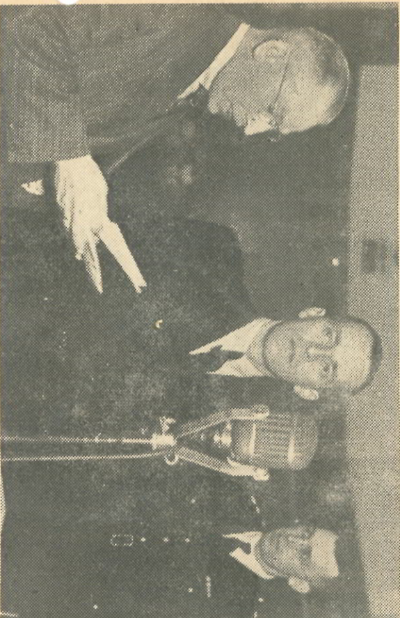
Cliche Nieuwe Hergese Courant

WEEKLIJKS NIEUWSBLAD VOOR HET PERSONEEL VAN DER HEEM N.V. - DEN HAAG - HOLLAND - NEDERLANDSCHE KROON RIJWELFABRIEK N.V.